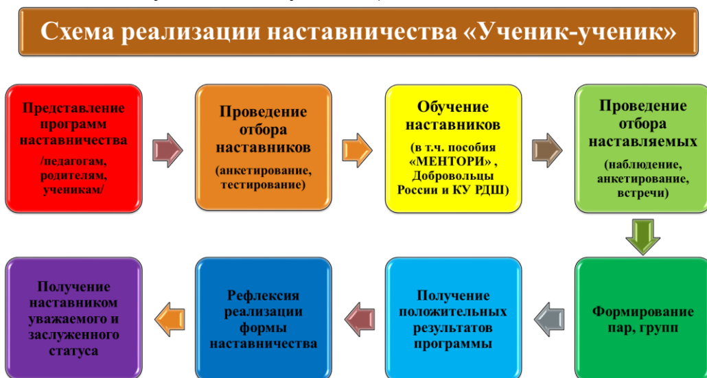
Рис.1. Описание схемы реализации наставничества «ученик-ученик»

Целью взаимодействия наставника и наставляемого является разносторонняя поддержка обучающегося с особыми образовательными/социальными потребностями либо временная помощь в адаптации к новым условиям обучения (включая адаптацию детей с ОВЗ).